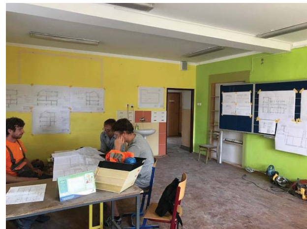
Kontrolní den na stavbě 19. 9. 2018