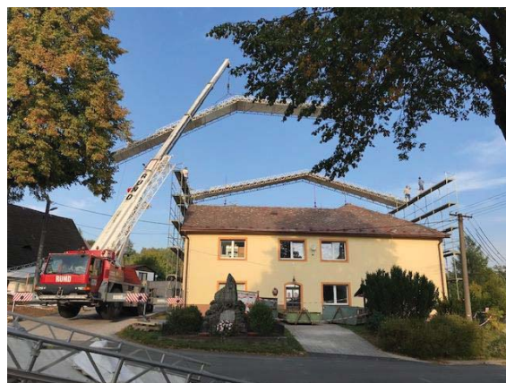
Stavba lešení a provizorní střechy 19. 9. 2018