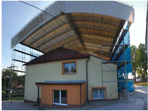
Škola pod střechou