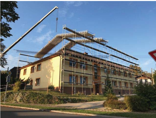
Stavba lešení provizorní střechy