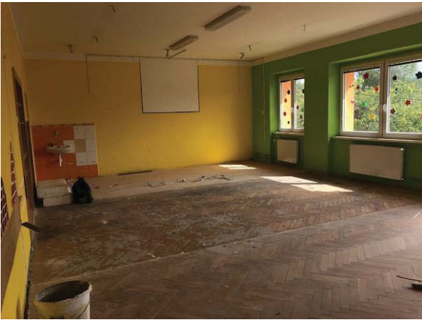
Příprava nové třídy ve druhém patře