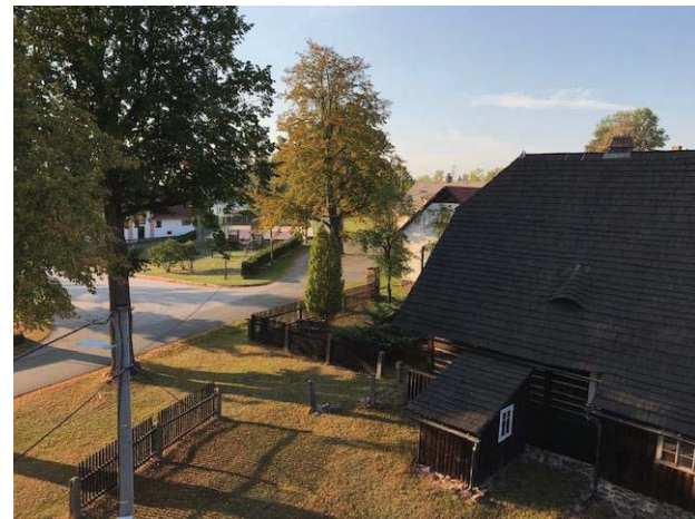
Pohled ze střechy školy