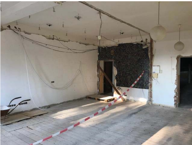
Vybouraná sborovna s ředitelnou