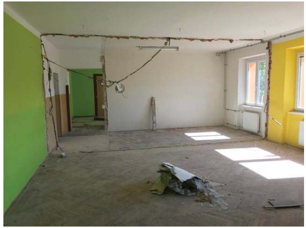
Příprava nové velké jídelny a školní auly