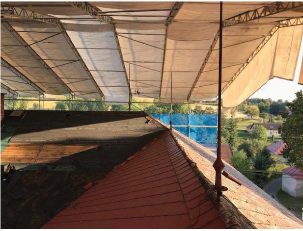
Pohled na hřeben střechy