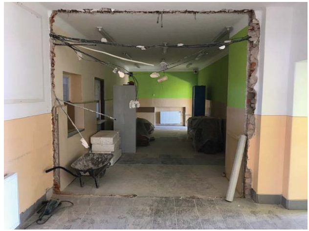
Pohled do jídelny