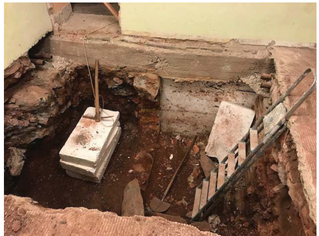
Šachta pro výtah – původní vstup do sklepa