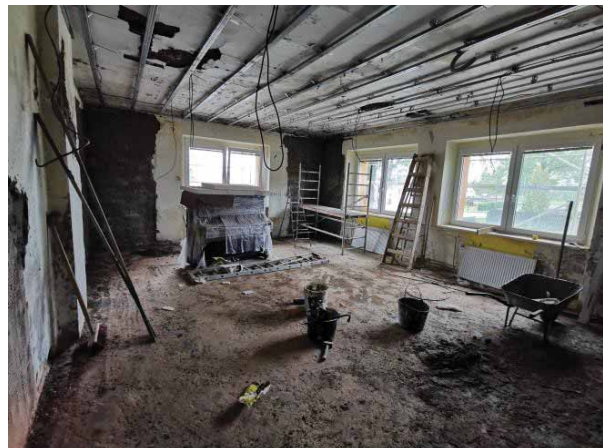
Rekonstrukce původní třídy