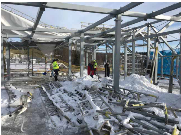
Zima v Dobřanech